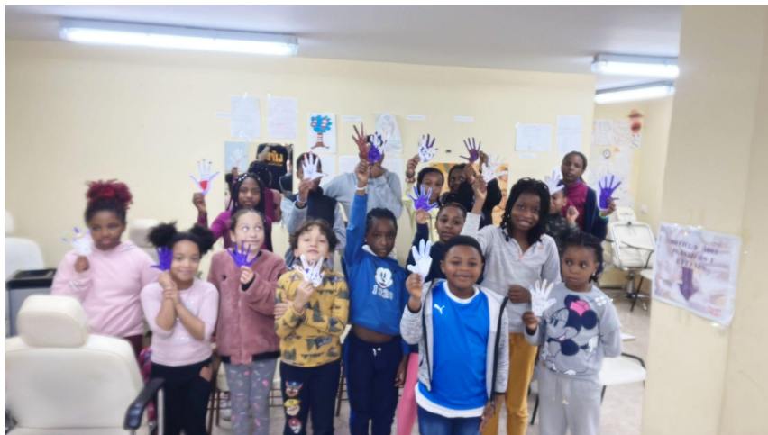
Campacole con los más peques de la Asociación