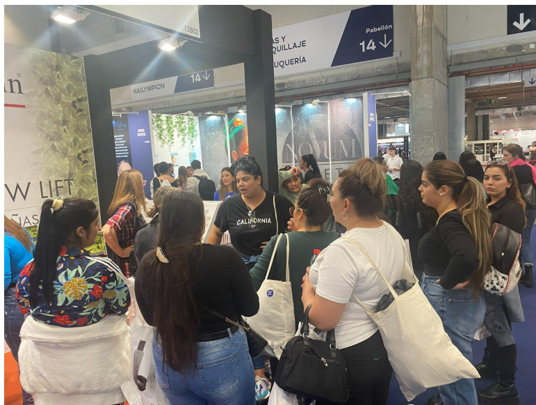
Salon Look 2022