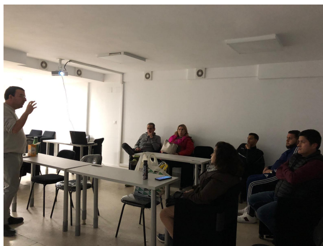
Taller de Inteligencia Emocional impartido en la Asociación