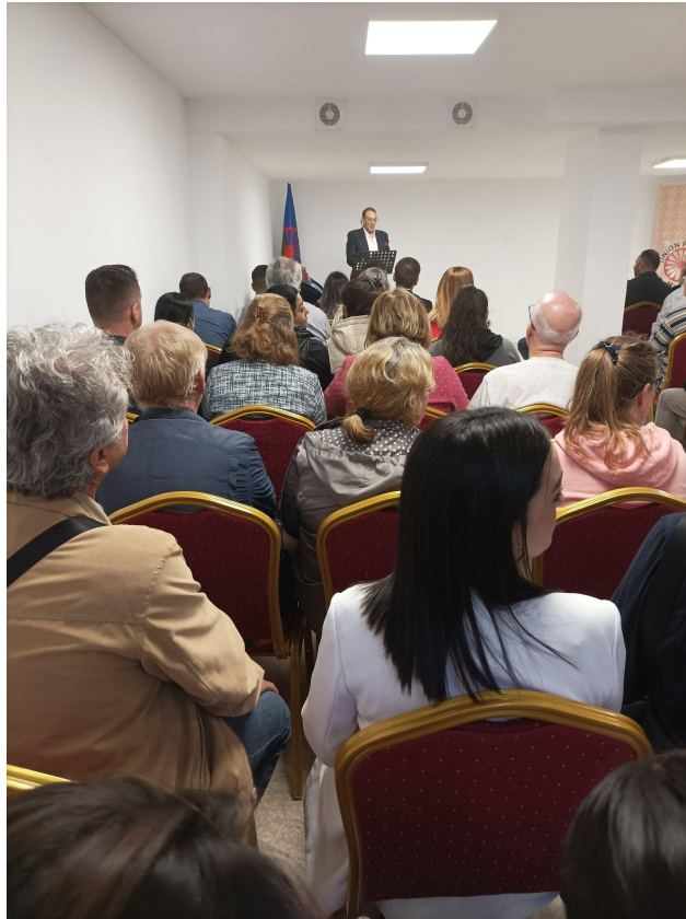
X Aniversario de Unión Romani Madrid