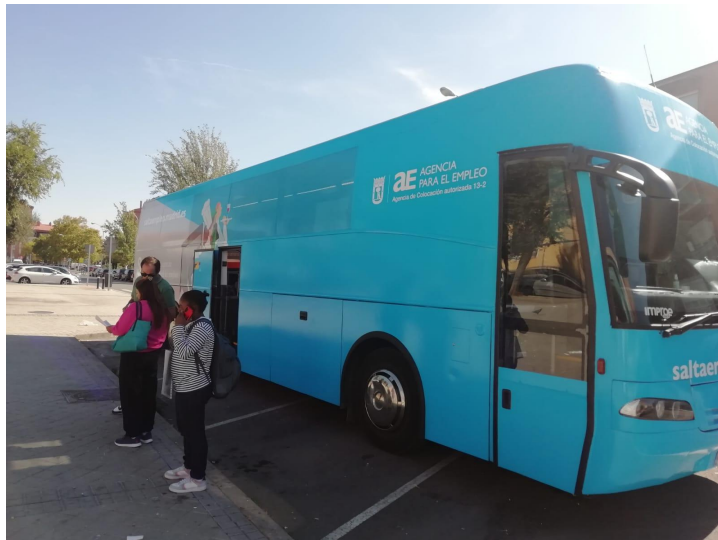
Excursión con los niños y niñas